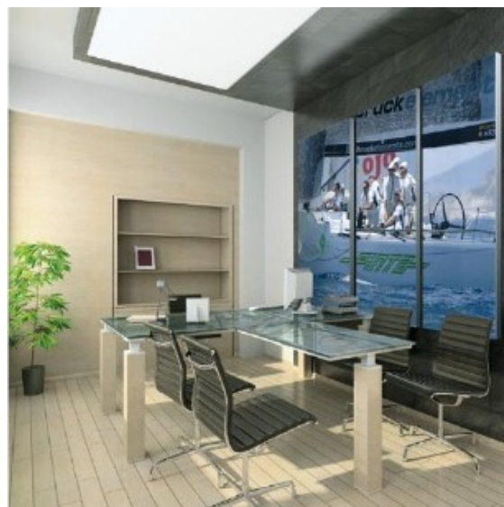
Absorción Pinta ARTWORK